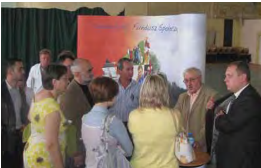
W ciechanowskim projekcie będzie brało udział 30 osób z czterech powiatów

23 czerwca br. rozpoczął się nabór kandydatów do projektu. Pierwszy etap naboru to spotkanie informacyjne, które odbyło się w Miejskim Zespole Szkół Nr 2 w Ciechanowie. Na spotkanie przybyło 119 osób, które otrzymały podstawowe informacje o projekcie. Zainteresowa-