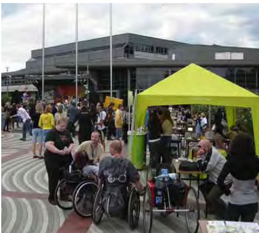
Targi Aktywizacji Zawodowej Osób Niepełnosprawnych