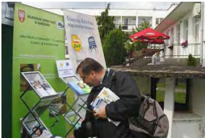
Filia WUP w Ciechanowie kładzie nacisk na dotarcie z informacją do mieszkańców wsi

W naszych promocyjnych działaniach nacisk kładziemy na przekazywanie informacji dla rolników i szerzej mieszkańców wsi. Poświętne jest właśnie takim miejscem. Targom towarzyszą spotkania reprezentacji rolników i ich organizacji z kierownictwem resortu rolnictwa, na których są podejmowane najbardziej pilne w danym roku zagadnienia czy to społeczne wsi, czy też produkcyjne i biznesowe. Spotkania te są znakomitą okazją do prezentacji