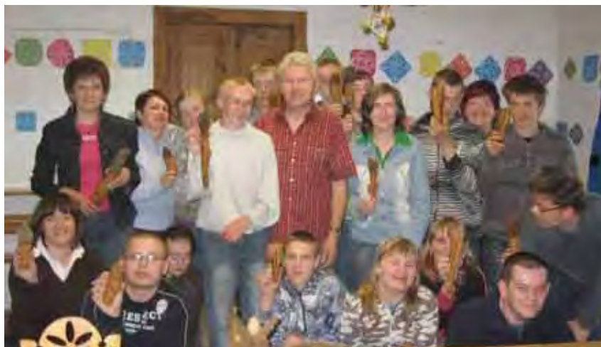
Prezentacja warsztatu zawodu rzeźbiarza

Reprezentanci Fundacji Kawalerów Maltańskich podczas jednego ze spotkań przedstawili projekt realizowany obecnie na naszym terenie. W ramach projektu Wsparcie osób niepełnosprawnych ruchowo na rynku pracy Kawalerzy Maltańscy oferują pomoc grupie osób niepełnosprawnych w zakresie: konsultacji zawodowych, psychologicznych, prawnych, także w miejscu zamieszkania; szkoleń i staży zawodowych;