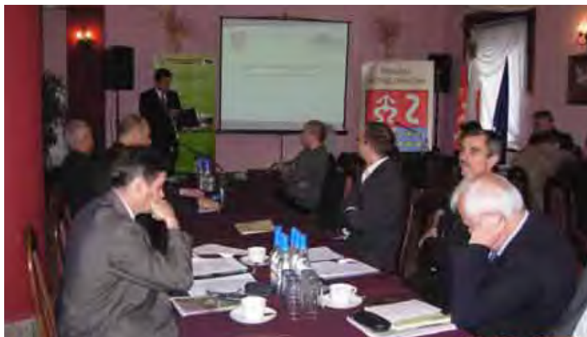
Priorytetem dla subregionu jest wsparcie przedsiębiorców

rencja poświęcona była w szczególności problemom społeczno-gospodarczym regionu, ale też była próbą znalezienia alternatywnych rozwiązań na utrzymujące się wysokie bezrobocie wśród mieszkańców