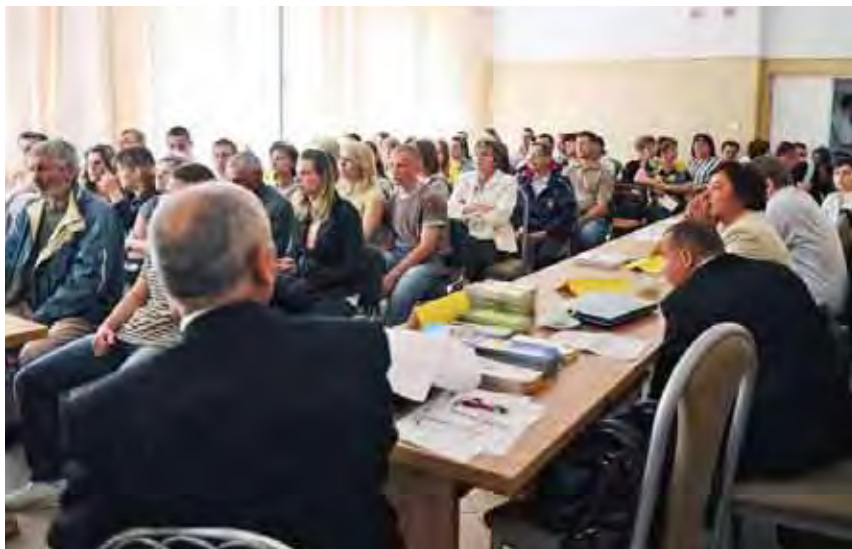
W spotkaniach licznie uczestniczyli mieszkańcy gminy Różan

Wiele osób skorzystało z możliwości zbadania predyspozycji zawodowych za pomocą testów. Informacja o przedsię-