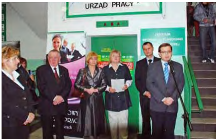
Siedleckie Targi Pracy odbyły się po raz szósty