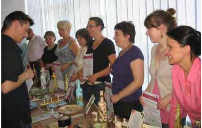
Prezentacje prac bezrobotnych, którzy brali udział w szkoleniu

W programie szkolenia był blok poświęcony przedsiębiorczości. Uczestnicy zapoznali się z zagadnieniami: zakładanie własnej firmy, marketing, pisanie ofert, pozyskiwanie funduszy na sfinansowanie własnej działalności, pozyskiwanie rynku zbytu, negocjacje handlowe,