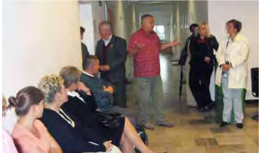
Rekrutację na przewodników i pilotów turystycznych prowadzili pracownicy PTTK

Efektom spotkań i rozmów było przeprowadzenie naboru na szkolenie spośród osób bezrobotnych z terenu powiatów: ra-