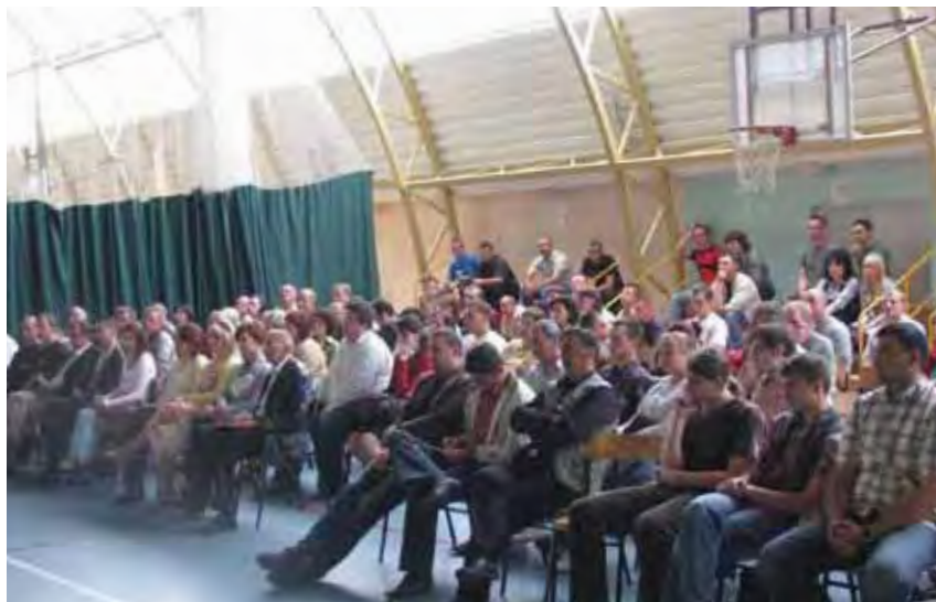
Spotkanie informacyjne dla projektu Akademia Przedsiębiorczości III w Ciechanowie

WUP w Warszawie będzie realizował projekt Przedsiębiorczość szansą dla kobiet o wartości 1 966 969 zł, adresowany do