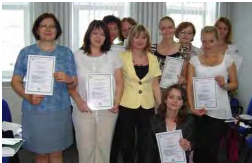
Na zakończenie spotkania uczestniczki otrzymały zaświadczenia

Każda z nich miała bardzo sprecyzowane oczekiwania co do szkolenia. Jedne chciały przede wszystkim nauczyć się lepszego radzenia sobie ze stresem, inne – zyskać więcej pewności siebie, jeszcze inne nastawiały się na kształtowanie postaw asertywnych. Wszystkie łączyła duża chęć samopoznania, rozwoju osobi-