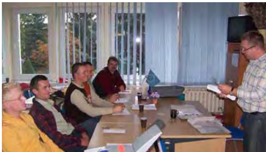
Kurs prawa jazdy - zajęcia teoretyczne

Projekt został skierowany do 15 pozostających bez zatrudnienia nie zarejestrowanych jako osoby bezrobotne mieszkańców Gminy Stromiec. Program szkoleniowo – doradczy obejmował do-