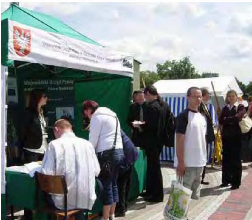
Stoisko Filii WUP w Siedlcach