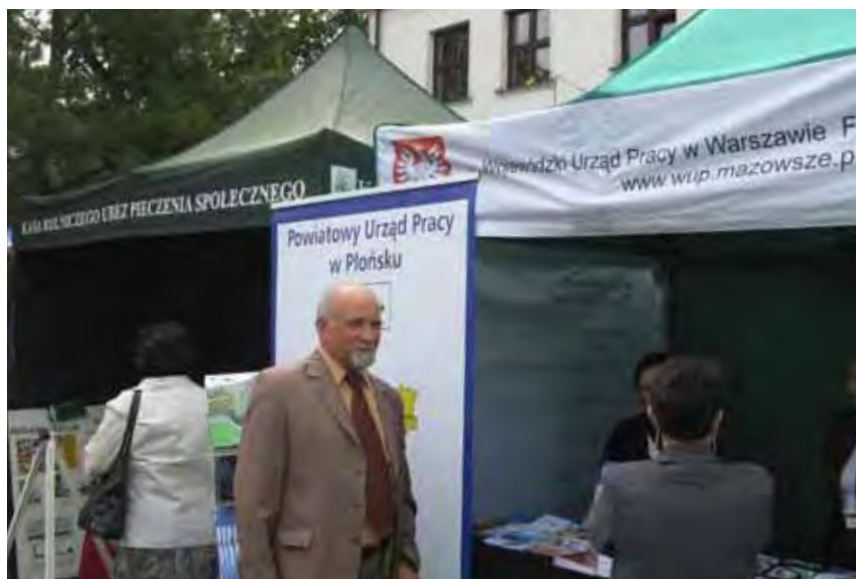
Na stoisku Wojewódzkiego Urzędu Pracy promowano usługi urzędu

W tegorocznych Dniach Mazowieckiego Rolnictwa oprócz Filii Wojewódzkiego Urzędu Pracy w Ciechanowie, podobnie jak w latach poprzednich wzięł udział Powiatowy Urząd Pracy w Płońsku i Centrum Edukacji i Pracy Młodzieży Ochotniczych Hufców Pra- ▶