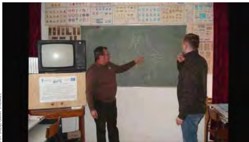
Trudne zagadnienia były omawiane na przykładach

Opr. Grzegorz Górski na podstawie materiałów z Urzędu Gminy Stromiec Zespół ds. Informacji i Promocji Wydziału Wdrażania EFS WUP w Warszawie