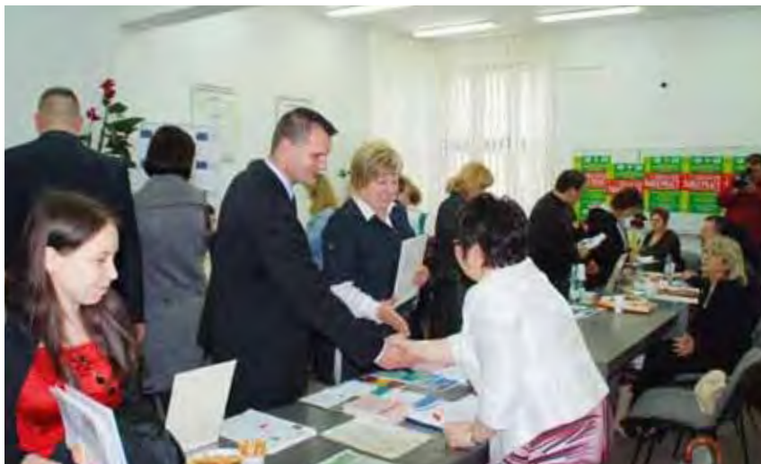
Stoiska konsultacyjne wystawców

Siedleckie Targi Pracy. Organizatorami przedsięwzięcia byli: Powiatowy Urząd Pracy w Siedlcach, Filia Wojewódzkiego Urzędu Pracy w Siedlcach, Wyższa Szkoła Finansów i Zarządzania w Siedlcach. Targi, jak co roku, cieszyły się bardzo dużym zainteresowaniem i przyciągnęły liczne grono osób poszukujących zatrudnienia oraz zainteresowanych rynkiem pracy. Swoje stoiska wystawiennicze, na trzech kondygnacjach urzędu, utworzyło 42 wystawców. Pracodawcy reprezentujący różne branże oferowali możliwości zatrudnienia m.in. na stanowiskach: serwisant, handlowiec sprzętu komputerowego, monter – pakowacz, ocynkowacz, monter, inżynier budowy, zarządca nieruchomości, dekarz