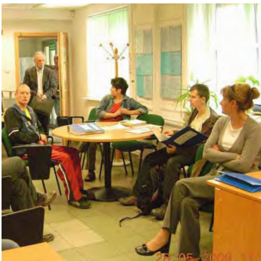
W spotkaniach rekrutacyjnych uczestniczyło 100 osób