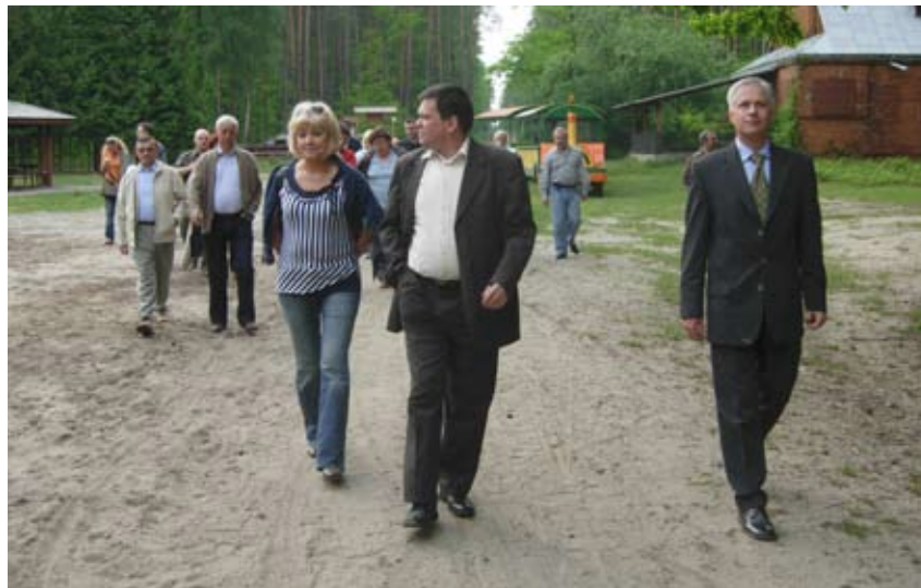
Uczestnicy konferencji zwiedzili ścieżkę dydaktyczną „Królewskie Źródła”.