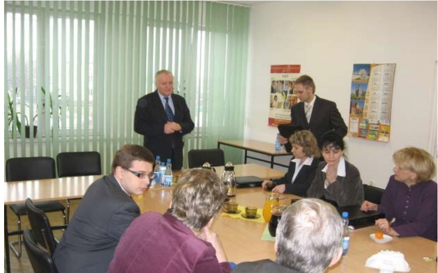
Na spotkaniu w Radomiu zachęcano do tworzenia kolejnych E-Centrow na Mazowszu.