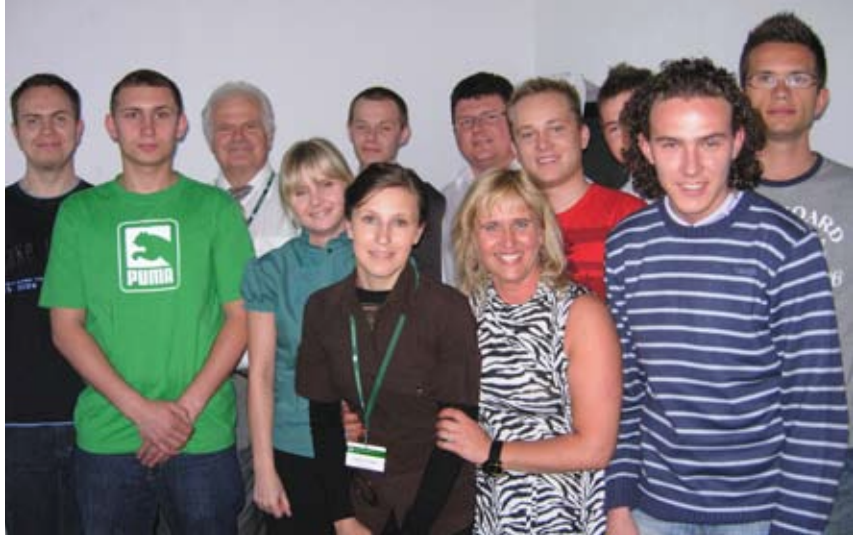
Studenci zdobywali wiedzę, jak zostać przedsiębiorcą.

Ostatni dzień to ćwiczenia na temat różnych sposobów zarządzania w firmie. Uczestnikom udało się wypracować credo efektywnych zespołów, którym przyświeca wspólny cel lub zadanie, gdzie dominuje atmosfera zaufania i otwartości, szczerza wymiana informacji, myśli i idei oraz poczucie identyfikacji z firmą. Słuchacze uzyskali informacje na temat instytucji wspierających mały i średni biznes oraz o moż-