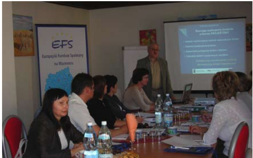
Uczestnicy wysoko ocenili warsztaty na temat przygotowania projektów z EFS.

Program dwudniowych warsztatów obejmował teoretyczne i praktyczne zagadnienia związane z opracowaniem projektów miękkich, w tym w szczególności: diagnozowaniem problemów i barier dotyczących beneficjentów ostatecznych, uzasadnianiem realizacji projektów, naborem i selekcją uczestników projektu, opracowywaniem budżetu projektu i kwalifikowalnością wydatków.