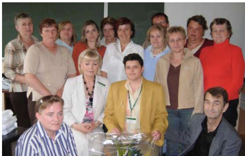
Każdy uczestnik został objęty indywidualnym planem pracy.

Uczestnicy klubu korzystali również z indywidualnych konsultacji prowadzonych przez psychologa i doradcę zawodowego. W efekcie nabytych umiejętności większości osób bezrobotnych udało się aktywnie włączyć w działania rynkowe, tj. ukończyć kursy zawodowe, podjąć stałą pracę lub wziąć udział w pracach społecznie użytecznych.