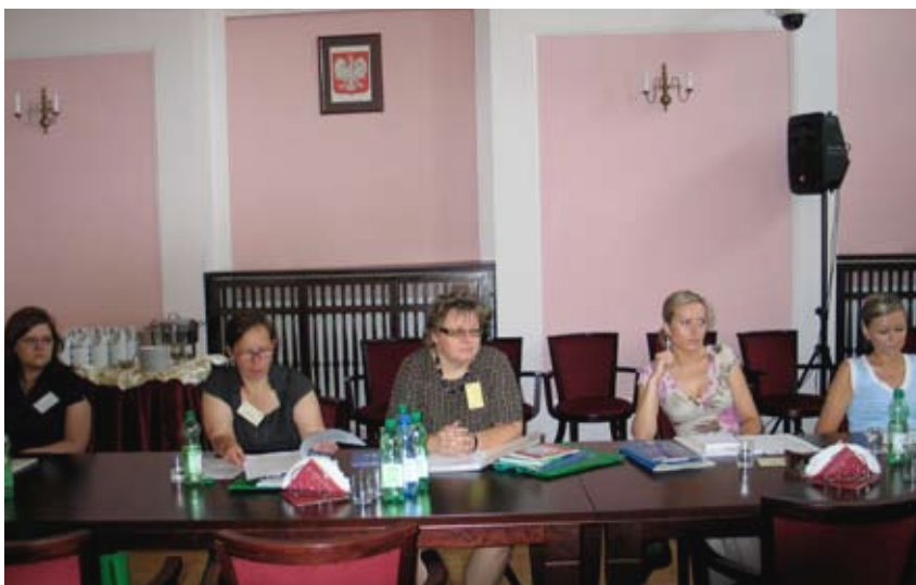
Właścicielki firm pytały o ofertę publicznych służb zatrudnienia.