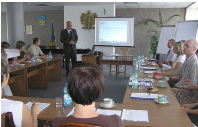
Na szkoleniach uczono zarządzania unijnymi projektami.

Wszystkie usługi są bezpłatne. Kadra ośrodka ma doświadczenie w realizacji projektów, dlatego też projektodawcy mogą liczyć na fachową pomoc. Szczegółowych informacji na temat Europejskiego Funduszu Społecznego i partnerstw lokalnych udziela również pracownik Punktu Informacyjnego. tel. 023 672 57 41; fax: 022 433 53 42; e-mail: info_ciechanow@roEFS.pl , ul. Małgorzacka 8 w Ciechanowie.