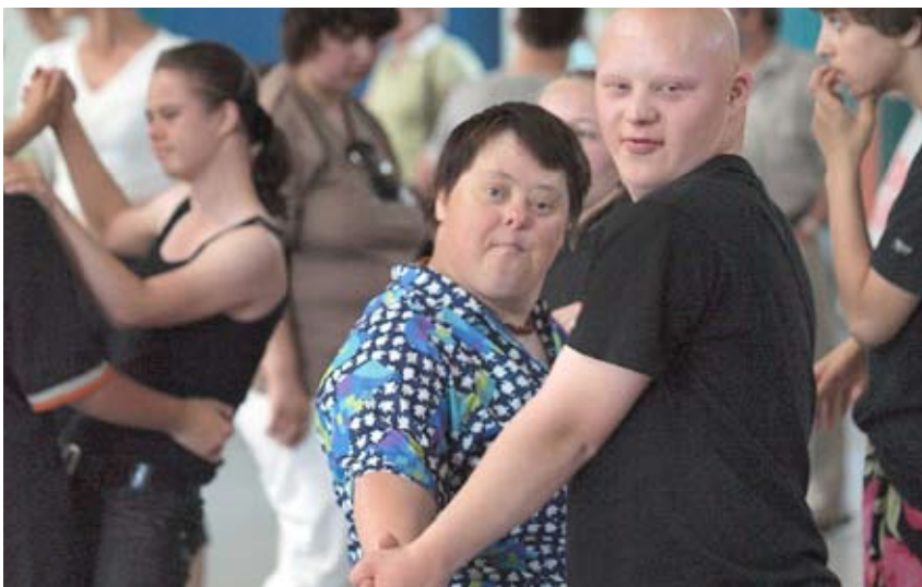
W czasie imprezy bawiło się ponad 450 osób z subregionu ostrołęckiego.