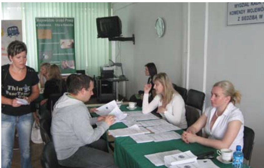
W Filii WUP w Radomiu prowadzono rekrutację do pracy w policji.

Kolejną propozycją „Dnia Otwartego” były wykłady dla osób poszu-