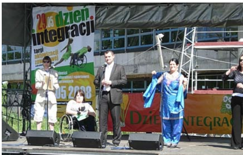
Do przedsięwzięcia został zaangażowany tłumacz języka migowego.

Natomiast siedlecka Filia WUP, we współpracy z Centrum oraz Powiatowym Urzędem Pracy w Siedlcach, zorganizowała Targi Aktywizacji Zawodowej Osób Niepełnosprawnych. Pracodawcy, instytucje i organizacje pozarządowe przedstawiły swoje oferty skierowane do osób niepełnosprawnych. Były to propozycje zatrudnienia na chronionym oraz otwartym rynku