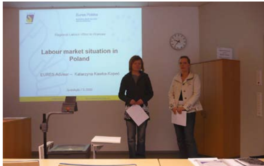
Finowie chętnie zatrudniają polskich specjalistów.

Fińscy pracodawcy nadal potrzebują pracowników zwłaszcza