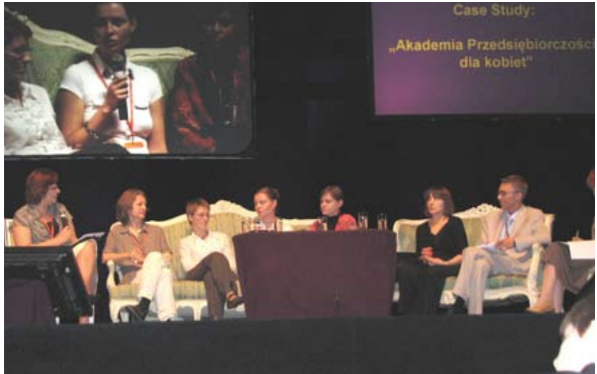
Panel dyskusyjny - case study projektu „Akademia Przedsiębiorczości dla Kobiet” Fundacji Kobiecej eFKa z Krakowa.

Głównym punktem drugiej części konferencji był panel dyskusyjny – case study projektu „Akademia Przedsiębiorczości dla Kobiet” Fundacji Kobiecej eFKa z Krakowa.