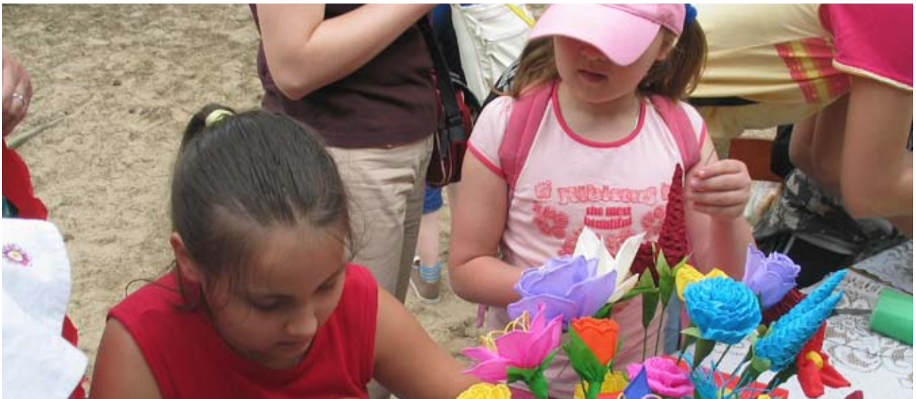
Dzieci z pasją tworzyły papierowe ozdoby i kwiaty z bibuły.

„Magiczna moc papieru” – pod takim hasłem odbywała się tegoroczna, ósma już edycja warsztatów etnograficznych „Ginące Zawody”. Honorowy patronat nad projektem sprawował Minister Kultury i Dziedzictwa Narodowego oraz Marszałek Województwa Mazowieckiego