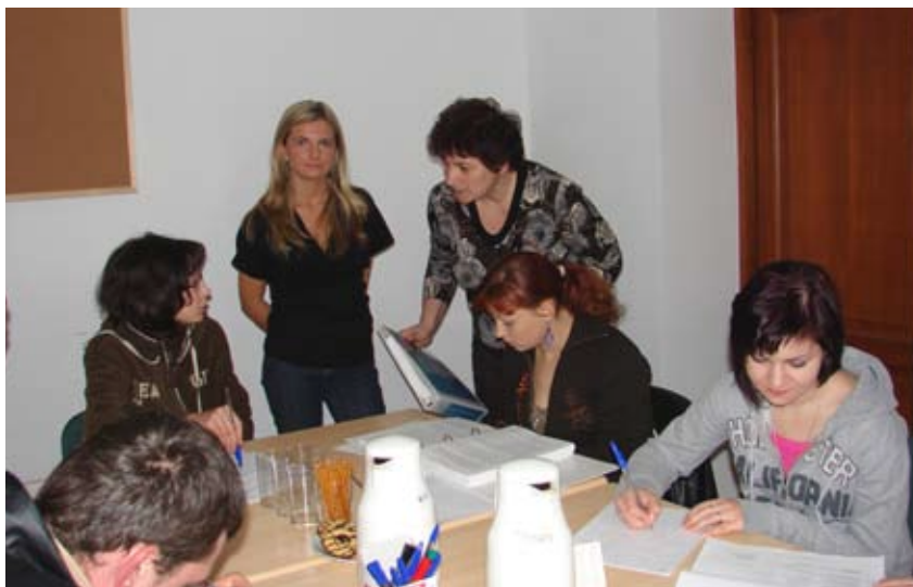
Doradcy zawodowi często prowadzą warsztaty dla poszukujących pracy.

W trakcie zajęć zainteresowani zdobywają i poszerzają wiedzę o metodach poszukiwania pracy, przygoto-