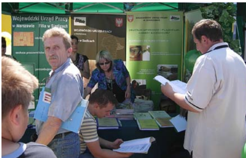
Oferty WUP cieszyły się dużym zainteresowaniem.

Siedlecka Filia Wojewódzkiego Urzędu Pracy przedstawiła blisko 2 tysiące miejsc pracy za granicą oraz około tysiąca propozycji zatrudnienia na terenie kraju, głównie na Mazowszu. Ponad 100 ofert skierowanych było do osób niepełnosprawnych, przeszło 150 dotyczyło pracy sezonowej. Była praca dla kontrolerów odprawy paszportowej, informatyków, piekarzy, cukierników, telemarketerów, pracow-