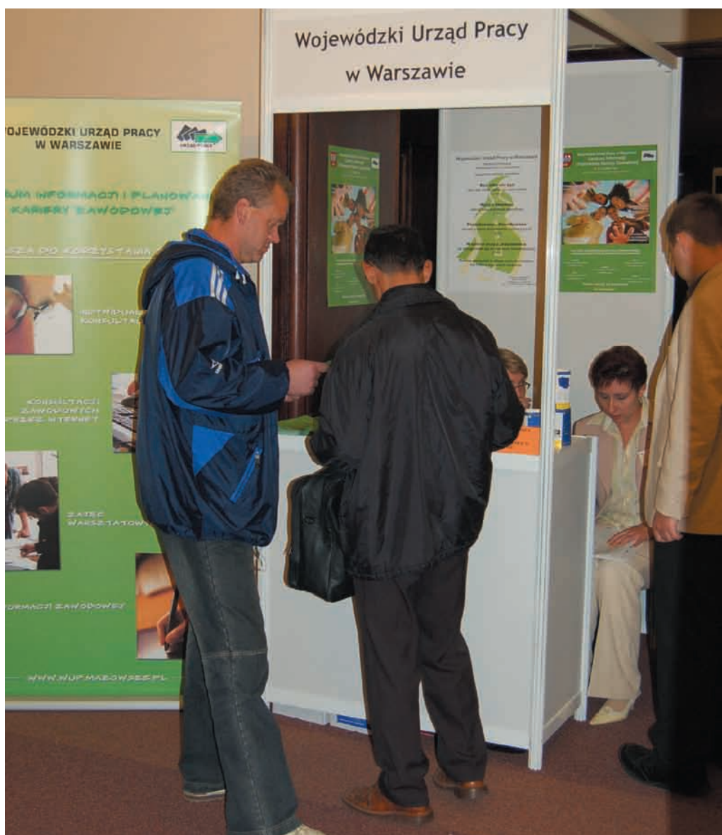
Targi pracy, w których bierze udział WUP znacząco wpływa na poziom bezrobocia

Spośród wszystkich bezrobotnych prawo do zasiłku posiada jedynie 12,6% (41.719 osób).