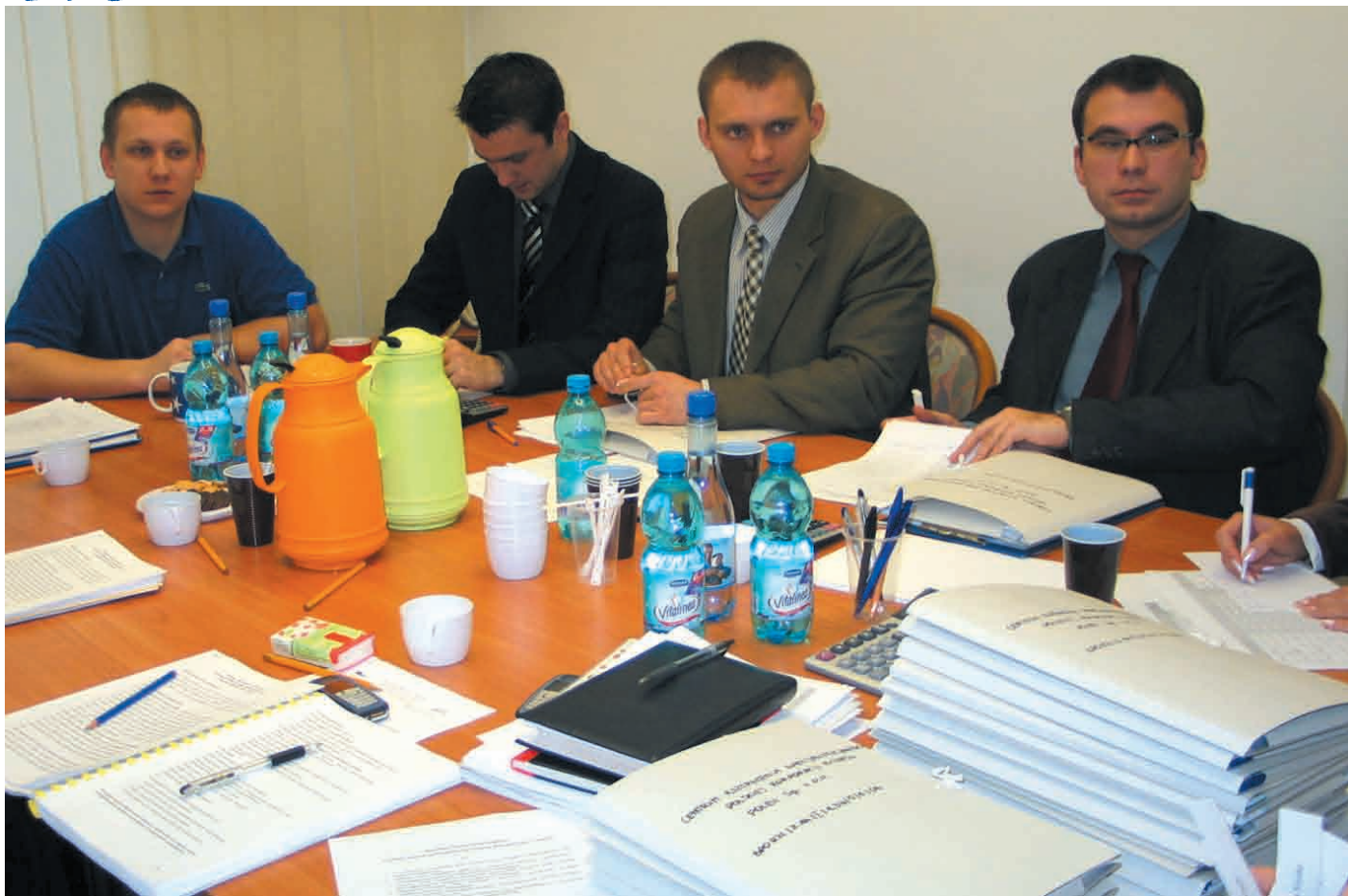
Był to pierwszy nabór wniosków, więc wszyscy uczyli się zasad aplikowania o środki unijne. Na zdjęciu: członkowie Komisji Oceny Projektów

pracy i możliwości kształcenia ustawicznego w regionie”