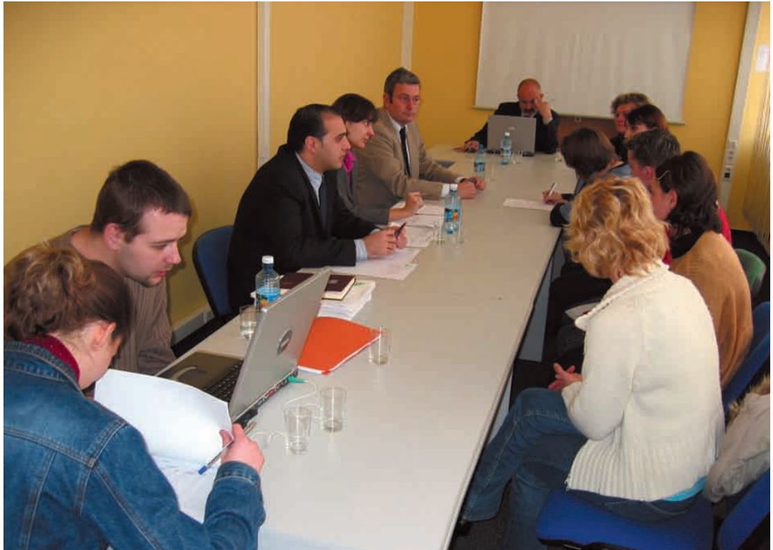
Pracodawcy z Hiszpanii prowadzą rozmowy kwalifikacyjne

JUŻ PO RAZ TRZECI WOJEWÓDZKI URZĄD PRACY W WARSZAWIE ZORGANIZOWAŁ NABÓR DO PRACY SEZONOWEJ DLA KOBIET PRZY ZBIORZE TRUSKAWEK W HISZPANII. WYJAZDY ODBYWAJĄ SIĘ NA MOCY UMOWY MIĘDZYRZĄDOWEJ PODPISANEJ MIĘDZY RZĄDEM RP, A KRÓLESTWEM HISZPANII W 2002 ROKU DOTYCZĄCEJ WZAJEMNEGO PRZEPLYWU PRACOWNIKÓW MIĘDZY OBU KRAJAMI I SĄ KOORDYNOWANE PRZEZ MINISTERSTWO GOSPODARKI I PRACY.