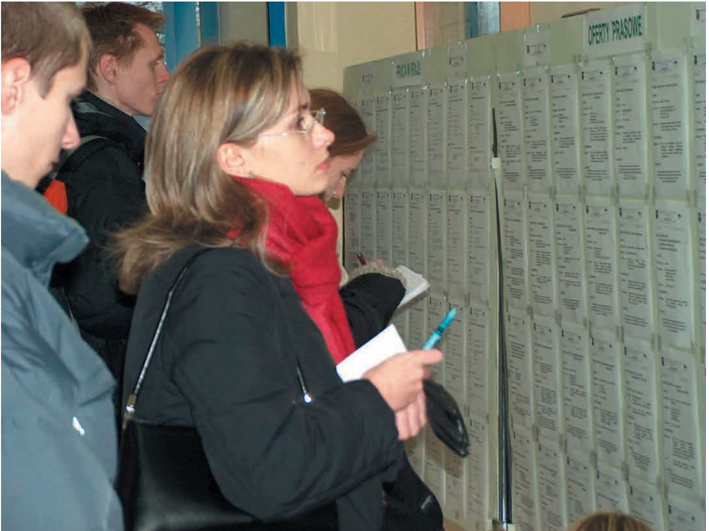
Uczestnicy targów oblegali stoisko z ofertami pracy

BLISKO 2000 UCZNIÓW SZKÓŁ PONADGIMNAZJALNYCH ORAZ STUDENTÓW UCZESTNICZYŁO W AKADEMICKICH TARGACH PRACY „DZIEŃ KARIERY” W PŁOCKU. SVOJE OFERTY PREZENTOWAŁY WYŻSZE UCZELNIE, CENTRA EDUKACJI I ZAKŁADY DOSKONALENIA ZAWODOWEGO.