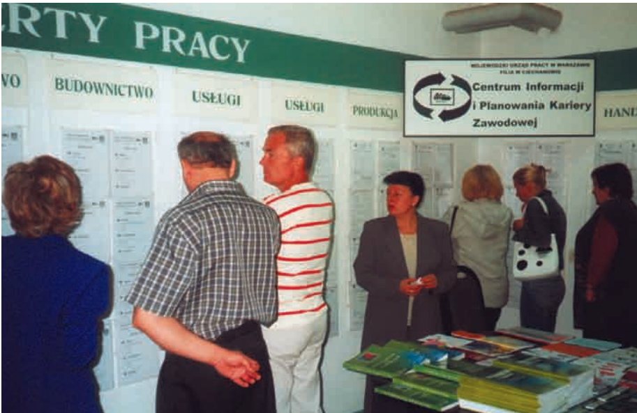
Główny cel: pobudzenie osób bezrobotnych do aktywności

BEZROBOTNI Z CIECHANOWA MOGĄ LICZYĆ NA POMOC WOJEWÓDZKIEGO URZĘDU PRACY I OŚRODKÓW POMOCY SPOŁECZNEJ. PRACOWNICY OBU INSTYTUCJI POMOŻĄ OSOBOM POSZUKUJĄCYM PRACY M.IN. W PLANOWANIU KARIERY ZAWODOWEJ.