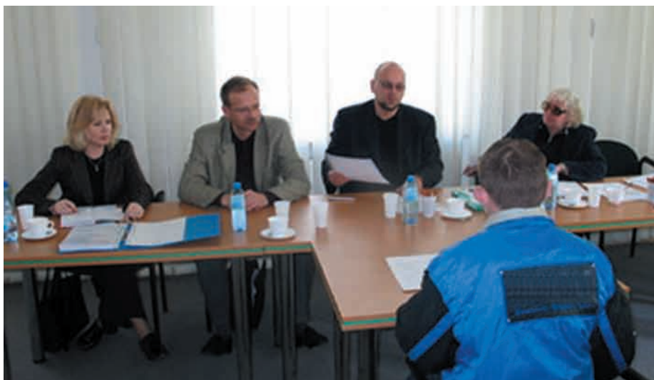
Ubiegający się o zastępczą służbę wojskową muszą przekonać komisję, że ich poglądy wykluczają założenie munduru

Rzecznik Prasowy WUP Aleksander Kornatowski