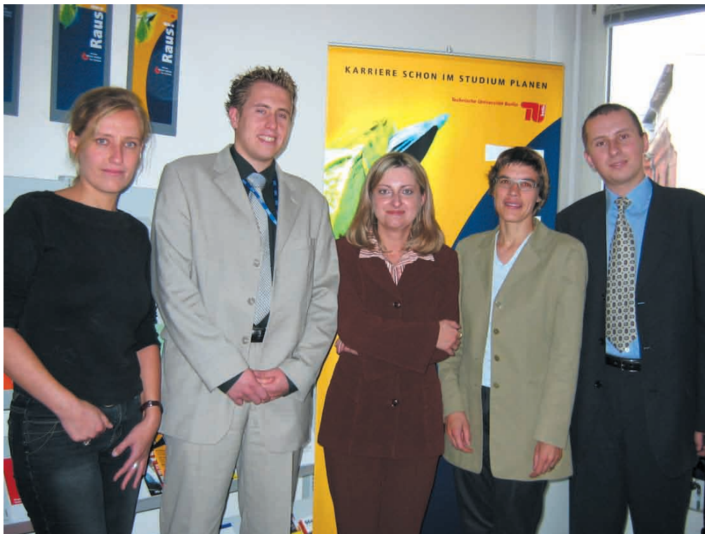
Tylko dobrze i wszechstronnie wykształcona kadra sprosta wymogom pracodawców w kraju i UE

Uczelni Łazarskiego do działalności na arenie międzynarodowej” uzyskał najwyższą ocenę Krajowej Agencji Programu. Odpowiada on na rosnące zapotrzebowanie z zakresu m.in. poradnictwa oraz doradztwa zawodowego i personalnego w UE. Przygotowanie specjalistów (ekonomistów, prawników, informatyków) do aktywno-