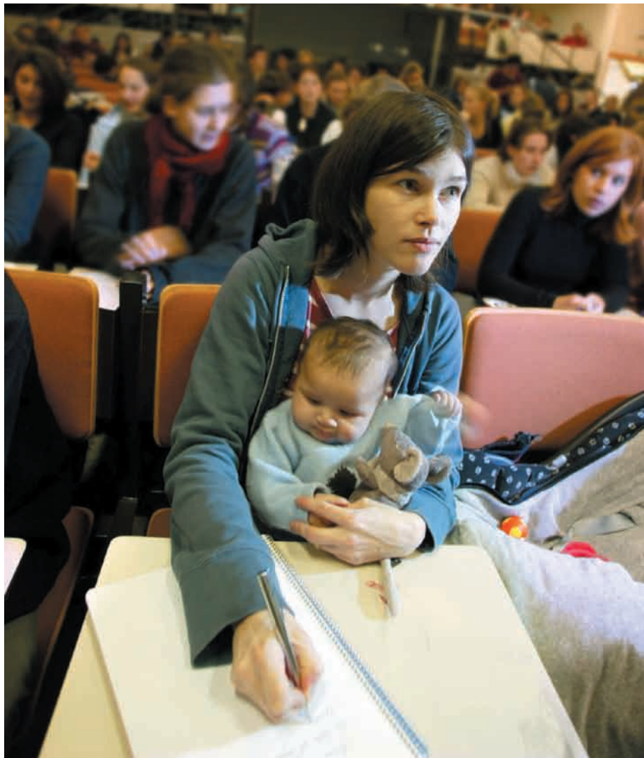
Z pomocy programu mogą skorzystać m.in. kobiety wracające na rynek pracy po okresie sprawowania opieki nad dzieckiem

Wymienione instytucje składają do Departamentu Wdrażania Europejskiego Funduszu Społecznego w Ministerstwie Gospodarki i Pracy wnioski o dofinansowanie projektu udzielenia kobietom wsparcia finansowego na podjęcie własnej działalności gospodarczej. Po uzyskaniu akceptacji wniosku, instytucje te podpisują z zainteresowaną osobą umowę, która określa wysokość oraz warunki udzielenia pomocy ze środków publicznych.