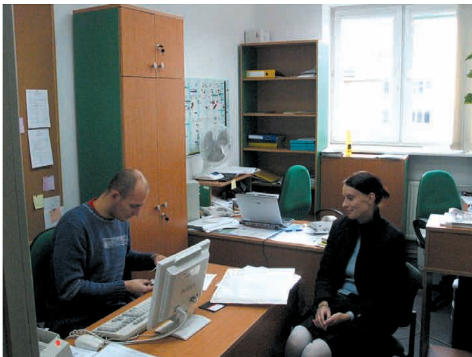
Pierwsze wnioski z EFS są już złożone w Wojewódzkim Urzędzie Pracy w Warszawie

Celem działania jest dostosowanie osób do funkcjonowania w zmieniających się warunkach społeczno-ekonomicznych oraz przygotowywanie ich do wykorzystania