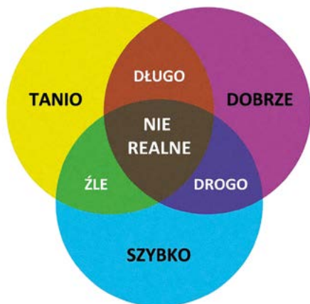
GRAFIKA 1: EFEKTYWNOŚĆ A CZAS

zrobione źle; jeżeli zadanie ma być wykonane tanio i dobrze = będzie robione długo; jeżeli zadanie ma być wykonane szybko i dobrze = będzie robione drogo.