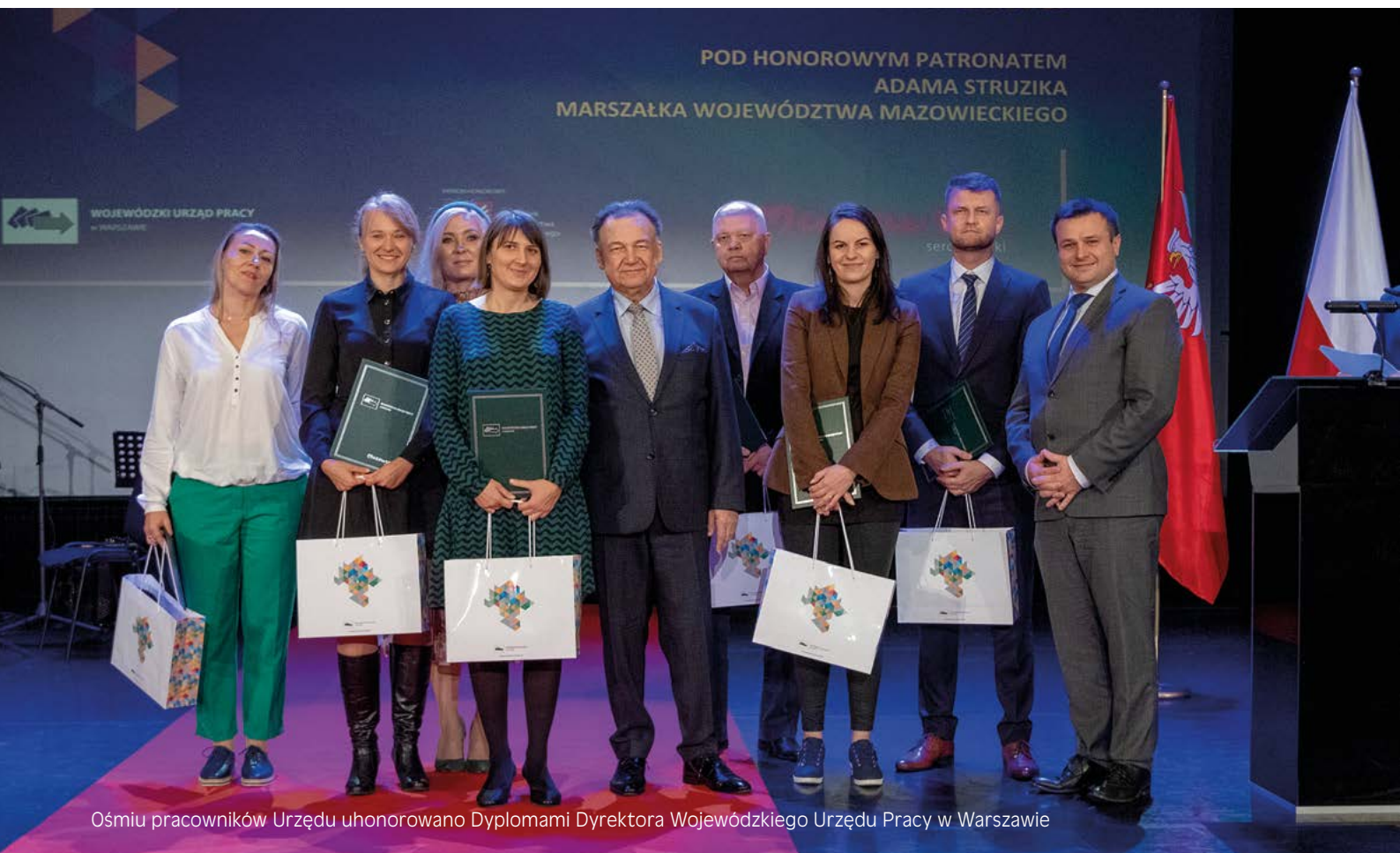
Ośmiu pracowników Urzędu uhonorowano Dyplomami Dyrektora Wojewódzkiego Urzędu Pracy w Warszawie