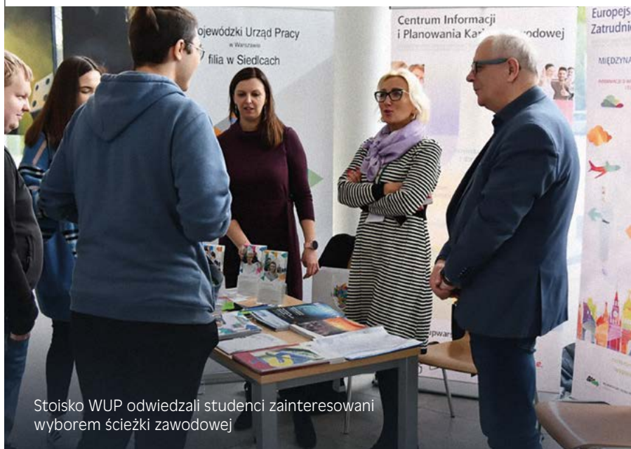
Stoisko WUP odwiedzali studenci zainteresowani wyborem ścieżki zawodowej