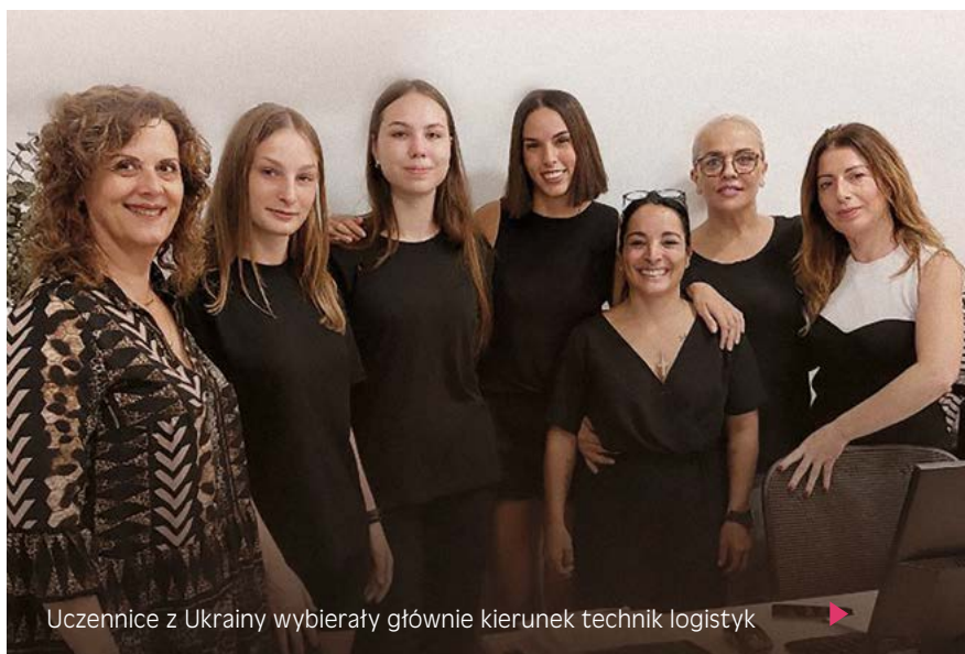
Uczennice z Ukrainy wybierały głównie kierunek technik logistyk

Pierwsze kroki samodzielności, nowi ludzie, nowy język i nowe miejsce zamieszkania to niezła mieszanka, w której znajdują się nastolatki. Jednak bez cienia wątpliwości możemy powiedzieć, że radzą sobie bardzo dobrze