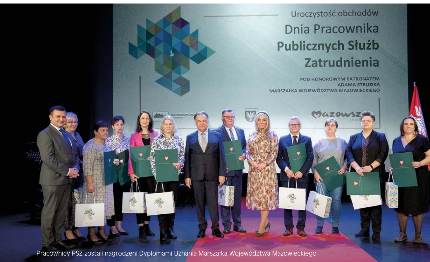
Pracownicy PSZ zostali nagrodzeni Dyplomami Uznania Marszałka Województwa Mazowieckiego

Pracownicy urzędów pracy na Mazowszu po raz dziewiąty uczestniczyli w Dniu Pracownika Publicznych Służb Zatrudnienia. Uroczystość, zorganizowana przez Wojewódzki Urząd Pracy, odbyła się 24 października w Mazowieckim Teatrze Muzycznym im. Jana Kiepury w Warszawie