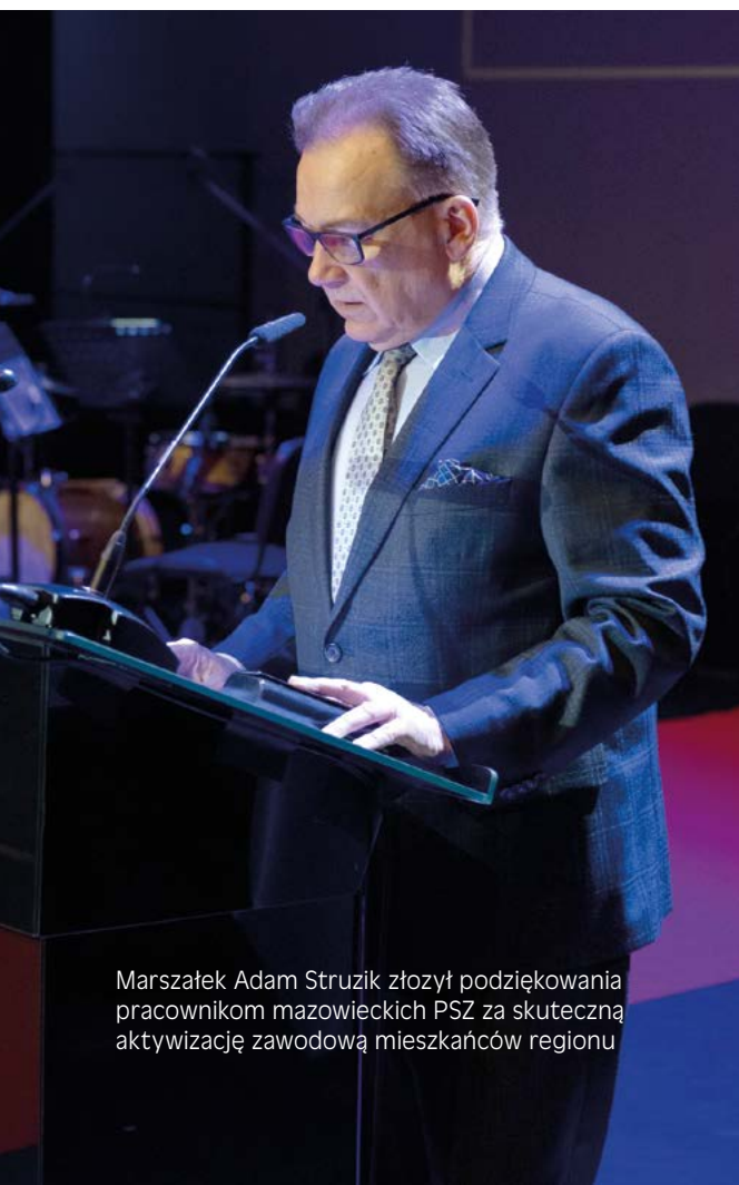
Marszałek Adam Struzik złożył podziękowania pracownikom mazowieckich PSZ za skuteczną aktywizację zawodową mieszkańców regionu

Na Mazowszu funkcjonuje 39 powiatowych urzędów pracy, w tym dwa miejskie (w Płocku i Warszawie), które zatrudniają około 2500 urzędników do obsługi bezrobotnych i poszukujących pracy mieszkańców naszego regionu. Wojewódzki i powiatowe urzędy pracy to kluczowe instytucje realizujące politykę rynku pracy w imieniu samorządów powiatowego i wojewódzkiego. ♦