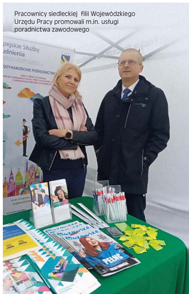
Pracownicy siedleckiej filii Wojewódzkiego Urzędu Pracy promowali m.in. usługi poradnictwa zawodowego

– Tegoroczne hasło imprezy #rolnictwo przyszłości #bezpieczeństwo żywnościowe uświadamia nam, jak ważną gałęzią polskiej gospodarki jest rolnictwo, szczególnie w kontekście obecnych niepokojów związanych