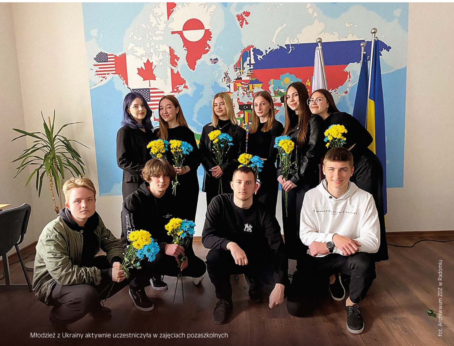
Młodzież z Ukrainy aktywnie uczestniczyła w zajęciach pozaszkolnych