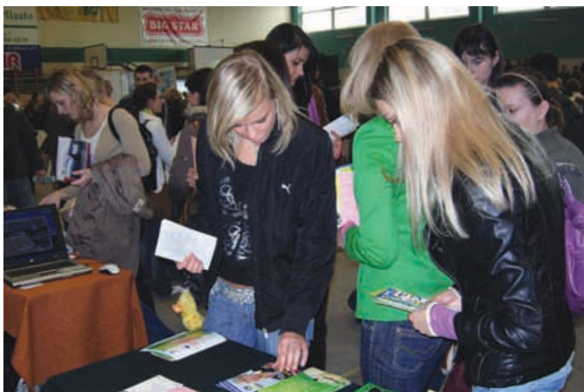
W Forach Edukacyjnych wzięło udział ponad 5 tys. uczniów z ciechanowskiego.

W tegorocznej edycji Forów Edukacyjnych, w 4 powiatach, wzięło