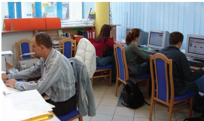
Wymiana informacji ułatwia poruszanie się po rynku pracy.

W rezultacie dzięki temu projektowi zwiększa się integracja między instytucjami rynku pracy, instytucjami szkoleniowymi, podmiotami społecznymi i lokalnymi. Pracownicy i menadżerowie instytucji rynku pracy mogą podnosić swoje kwalifikacje i umiejętności. Rozwija się współpraca z lokalnymi przedsiębiorstwami,