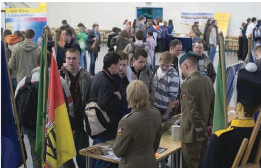
Po raz pierwszy z ofertą edukacyjną wystąpiły szkoły wojskowe.

2500 osób uczestniczyło w Młodzieżowych Targach Edukacji i Pracy, które odbyły się w kwietniu w Ostrołęce. Pomyślną i organizatorem targów była Filia Wojewódzkiego Urzędu Pracy, a współorganizatorami Centrum Edukacji i Pracy Młodzieży OHP, prezydent Ostrołęki, starosta ostrołęcki, delegatura Urzędu Marszałkowskiego oraz delegatura Kuratorium Oświaty.