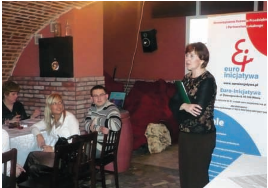
Członkowie stowarzyszenia wspierają rozwój lokalny.

morządowej we wszystkich sprawach mających znaczenie dla rozwoju regionu. Chce podejmować wspólne inicjatywy zmniejszające bezrobocie wśród ludności regionu, wspierać i rozwijać więzi lokalne i regionalne, podejmować przedsięwzięcia w zakresie kultury, nauki, edukacji i rozwoju lokalnego. Najnowszą inicjatywą jest powołanie Funduszu Poręczeń Kredytowych. Stowarzyszenie, przy współpracy Filii Wojewódzkiego Urzędu Pracy i Powiatowych Urzędów Pracy z subregionu ciechanowskiego, zamierza utworzyć Lokalny Fundusz Poręczeń Kredytowych. O powodzeniu i skuteczności tego przedsięwzięcia decydować będzie zaangażowanie i wsparcie wielu partnerów społecznych oraz instytucji finansowych i gospodarczych. Wstępne założenia funkcjonowania funduszu wraz z listem intencyjnym przekazano do samorządów lokalnych, organizacji pozarządowych, instytucji finansowych. Organizato-