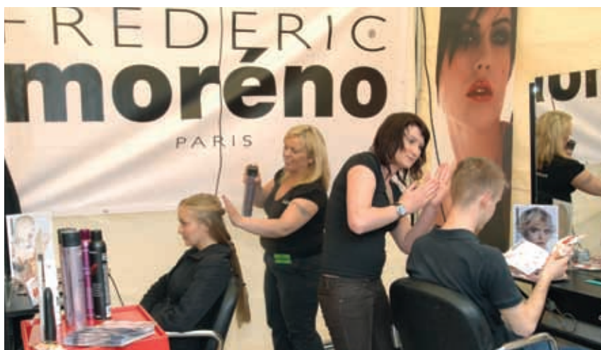
„Strefa Sukcesu” pomaga studentom budować wizerunek.