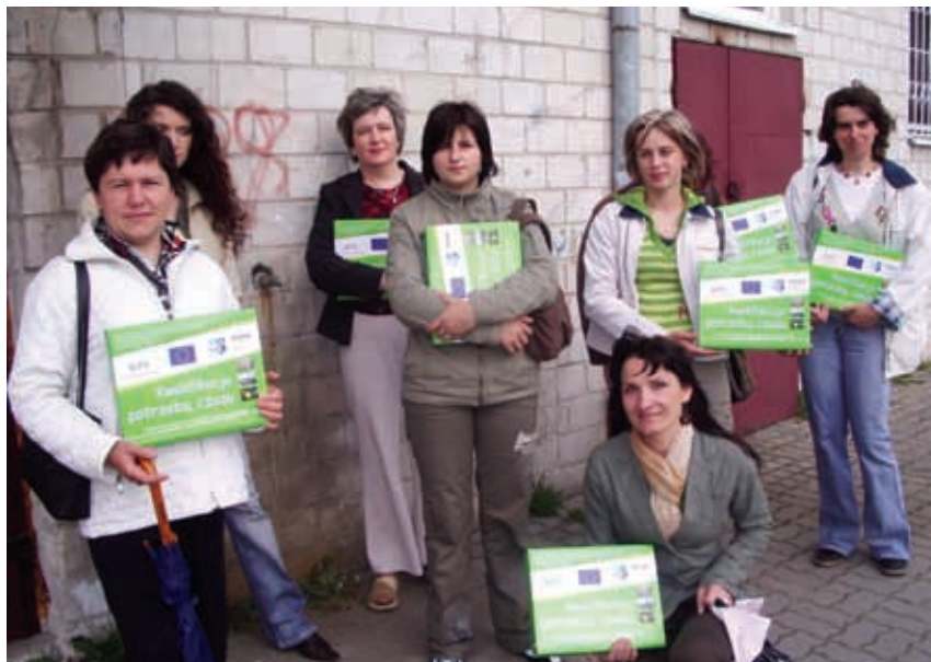
Uczestnicy projektu otrzymali certyfikaty.

Nowatorskim rozwiązaniem było zatrudnienie trenerów, którzy w ramach prowadzonych ćwiczeń badali predyspozycje i możliwości każdego z uczestników szkolenia, uczyli ich nowoczesnych technik i metod poruszania się po dynamicznie zmieniającym się rynku pracy. W programie zajęć znalazły się warsztaty psychologiczno-ak-