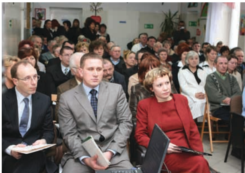
Na konferencji podsumowującej przedstawiono efekty projektu.

W marcu odbyła się konferencja podsumowująca projekt. Na spotkaniu, oprócz prezentacji rezultatów, przedstawiono działania Regionalnego Ośrodka Europejskiego Funduszu Społecznego w Płocku, który swoim zasięgiem obejmuje powiat płocki, gostyniński i sierpecki.