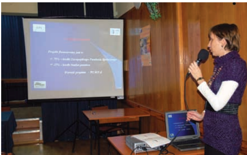
Projekt zdobył uznanie wśród rolników i pracodawców.