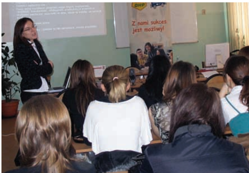
Młodzi OHP podczas zajęć prowadzonych przez doradców zawodowych.

Beata Chmiel-Czajka, Aleksandra Mięczakowska MCIZ Warszawa